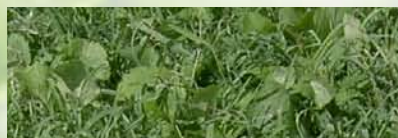
Seigle « Multicaule » + Navette