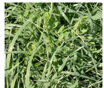
Seigle « Multicaule » + Vesce commune