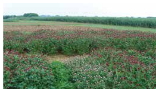
Sélection trèfle incarnat Station de sélection JD de St Sauvant (86)

Essais développement JD - Station de St Sauvant (86)